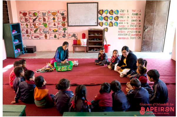
आपेरोनद्वारा सहयोग गरेको शिक्षकले प्रारम्भिक बाल विकास कक्षामा बालबालिकालाई सिकाउदै