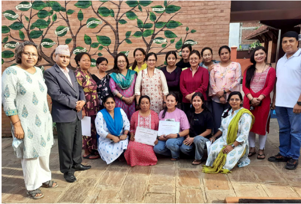
स्वास्थ्य निर्देशिका सम्बन्धि तालिमको समापन पश्चात् सामुहिक फोटो