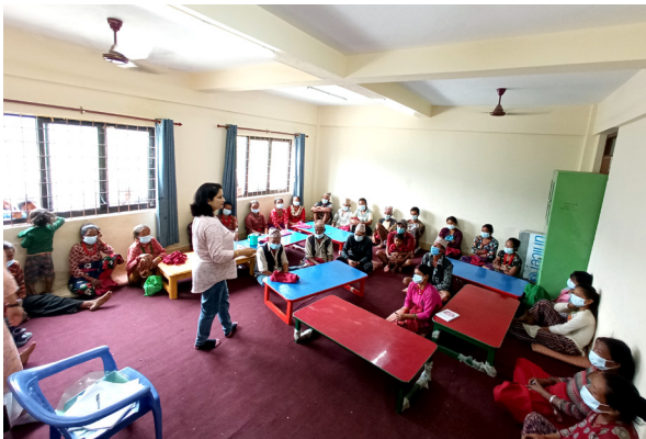
अभिभावकिय भूमिका र दायित्वबारे अभिभावकलाई अभिमुखिकरण