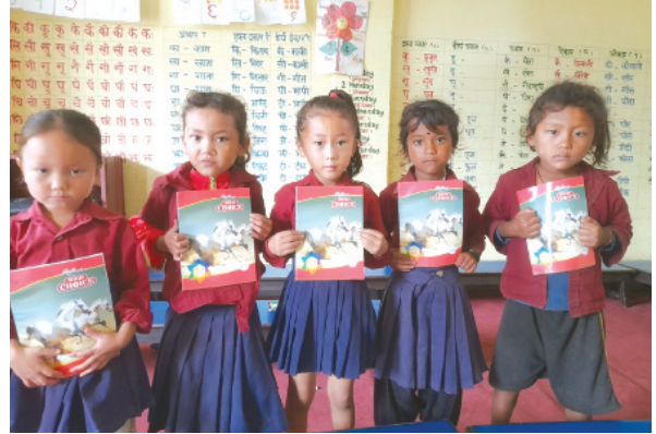
श्री काठमाडौं आधारभुत विद्यालयका बालबालिकाहरू अतिरिक्त क्रियाकलापमा उपहार लिएको