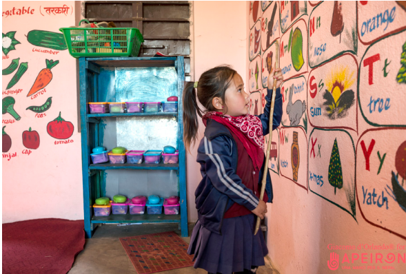
प्रारम्भिक बाल विकास केन्द्रमा अध्ययन गर्दै बालिका