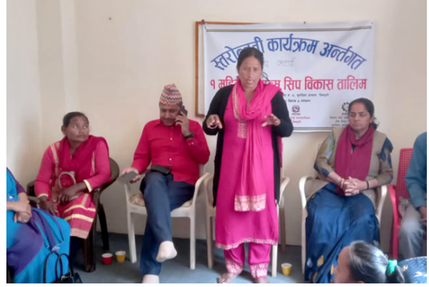
सिन्धुली आवास गृहमा सिलाई तालिमको समापन कार्यक्रममा अतिथिज्यूहरू