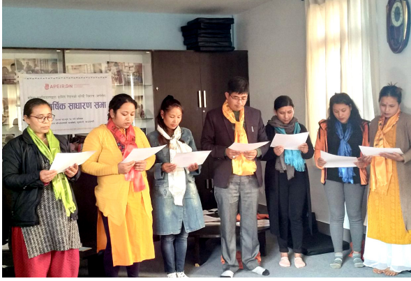
आपेरोनको निर्वाचित कार्यसमितिको सदस्यहरू