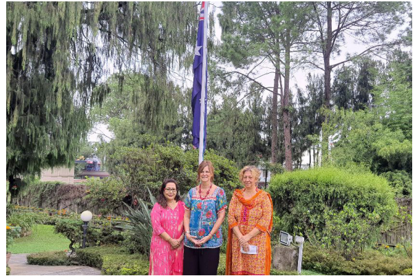
अष्ट्रेलियन राजदूतावाससँग संयुक्त बैठक