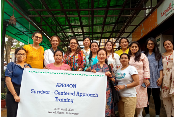
प्रभावित केन्द्रित अवधारणा सम्बन्धि कर्मचारीहरूलाई तालिम