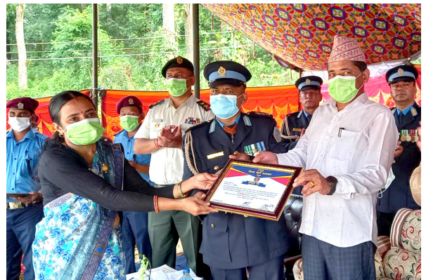
जिल्ला प्रहरी कार्यालय सिन्धुलीबाट आपरोनलाई प्रशंसा पत्र प्रदान