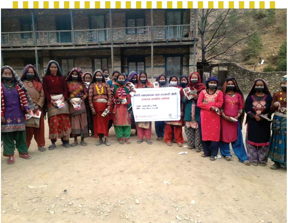
Figure 6: Training on Nursery Management at Jumla