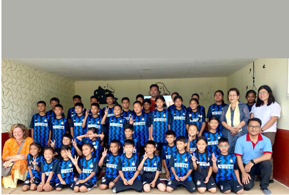
फुटबल तालिममा सहभागी विद्यार्थीहरू