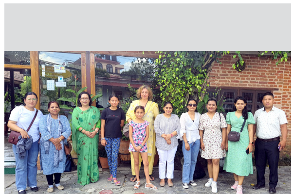
आपेरोन ODV को प्रतिनिधिसँग आपेरोनको कर्मचारीहरू भेटघाट