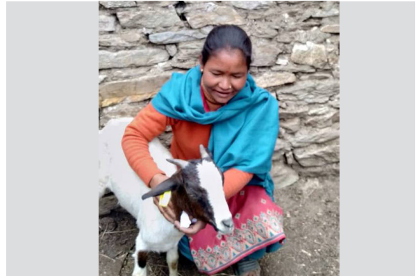
जुम्ला जिल्लामा बाख्रापाखलनको लागि सहयोग