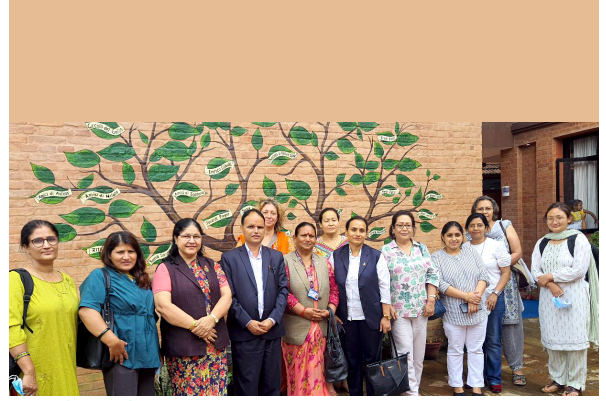
राष्ट्रिय महिला आयोगबाट काजा नेपाल आवास गृहमा अनुगमन