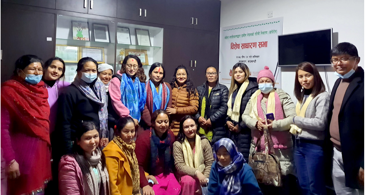
Figure 1 : Special General Assembly of APEIRON

APEIRON ले लैङ्गिक हिंसा प्रभावित महिला र बालबालिकाहरूको विभिन्न चुनौतीहरूको समाधान गरी उनीहरूको जिवनस्तर उकासी स्वस्थ्य, सक्षम र क्षमतावान् नागरीक बनाउनको लागि निम्न ५ वटा क्षेत्रमा काम गर्दै आइरहेको छ। (क) लैङ्गिक हिंसा रोकथाम र प्रतिक्रिया (ख) प्रभावित महिला र सामाजिक आर्थिक सशक्तिकरण (ग) अनाथ तथा प्रभावित बालबालिकाहरूको संरक्षण र शिक्षा (घ) महिला, पुरुष तथा किशोर किशोरीहरूको प्रजनन स्वास्थ्य अधिकार (ङ) संस्थागत साम्बेदारी र सहयोग। आ.व. २०७८-२०७९ मा यस संस्थाले गरेको विभिन्न परियोजना तथा कार्यक्रमहरूका मुख्य उपलब्धिहरूलाई छोटकरीमा प्रस्तुत गरिएको छ।