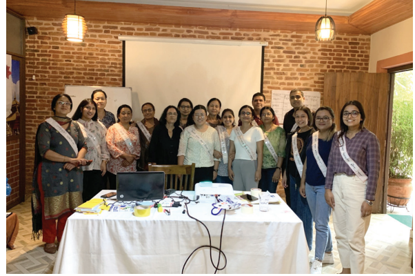
उद्यमशिलता तथा बित्तिय साक्षरता सम्बन्धि कर्मचारीहरूलाई तालिम