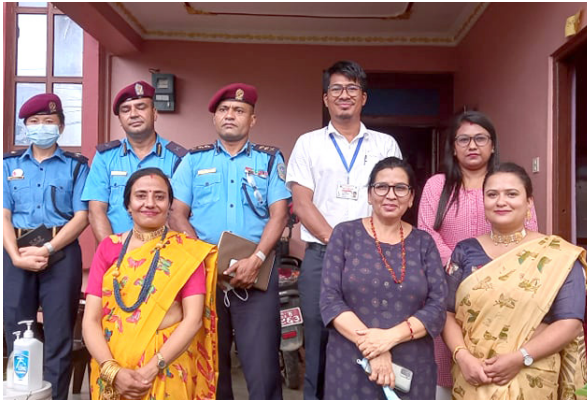
सिन्धुली आवास गृहमा जिल्ला प्रहरी कार्यालय र लैङ्गिक हिंसा एकद्वार संकट व्यवस्थापन कार्यालयबाट संयुक्त अनुगमन