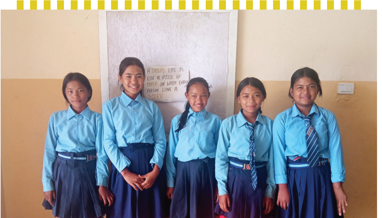
Figure 5: Support to children