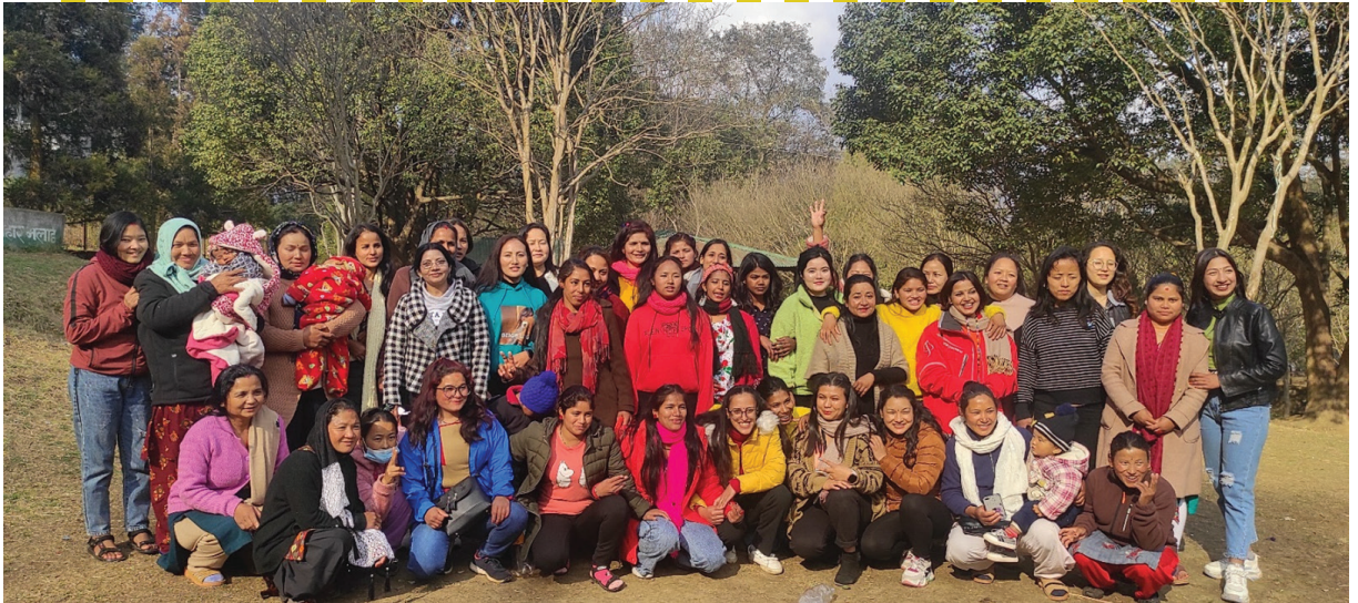
Figure 2: Recreational Picnic Program of Casa Nepal Residents