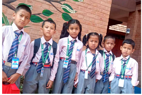
काजा नेपालमा रहेका बालबालिकाहरू विद्यालय जान तयारी