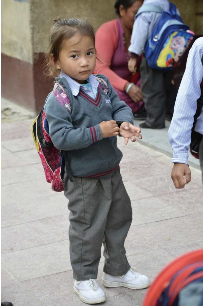
Figure 4: Education support to attend school regularly