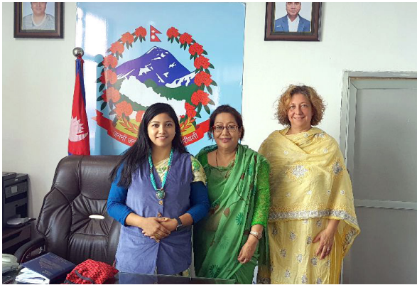
काठमाण्डौं महानगरपालिकाको उपमेयरज्यूसँगको बैठक