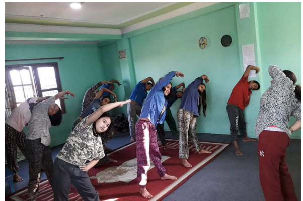
योगा गर्दै सानोनानीका बालबालिकाहरू