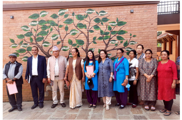
कागेश्वरी मनोहरा नगरपालिकाको प्रतिनिधिज्यूहरूबाट काजा नेपालमा अनुगमन