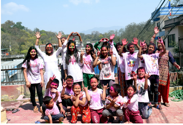
होली पर्व मनाउदै सानोसानीका बालबालिकाहरू