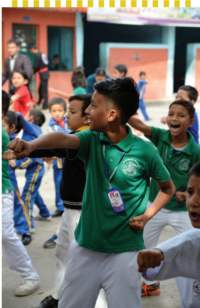
Figure 3: Participating in Taekwondo in Shambhavi School

परियोजना निरन्तरताको लागि सहयोग दातासँग समन्वय गर्ने ।