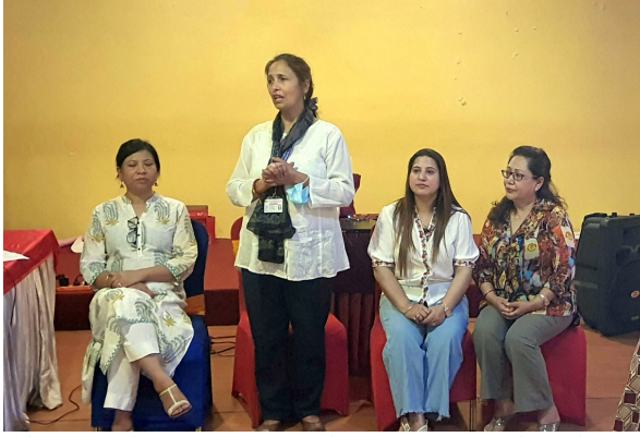
महिला, बालबालिका तथा ज्येष्ठ नागरीक मन्त्रालयबाट प्रभावित केन्द्रित अवधारणा तालिमको समापन कार्यक्रममा बोल्दै